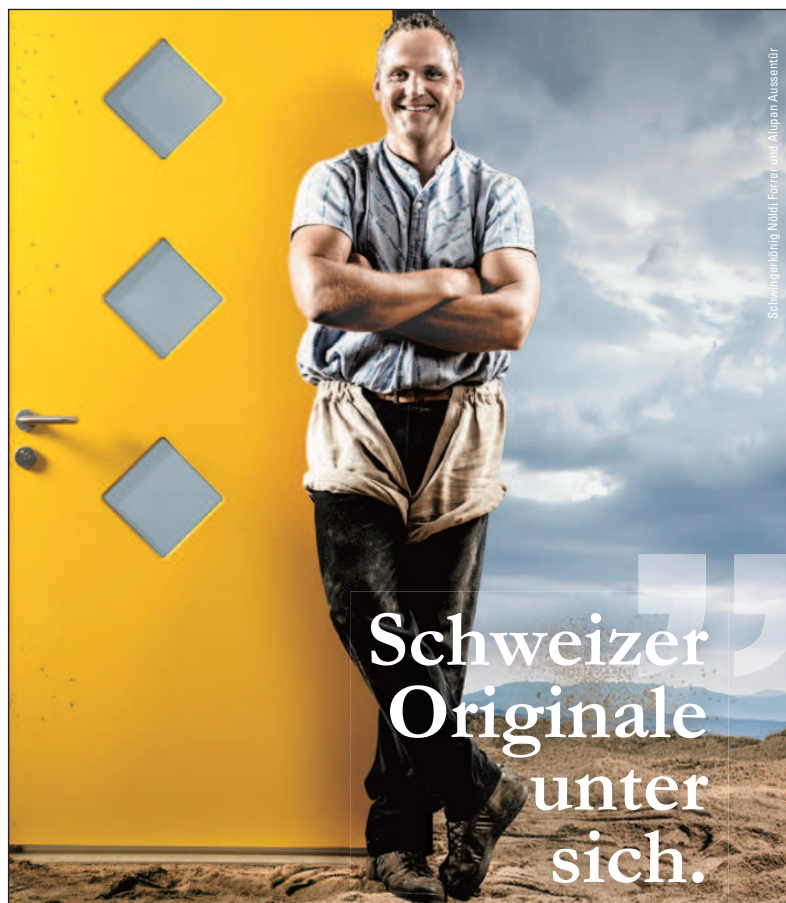
Schwingerlöch Nidel Ferro und Alupan Aussentür