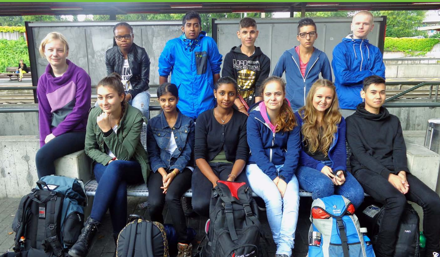
Die Klasse W15 am Bahnhof Wohlen – gut ausgerüstet für die Outdoortage.

Ein sportlicher Einstieg ins Arbeitsjahr