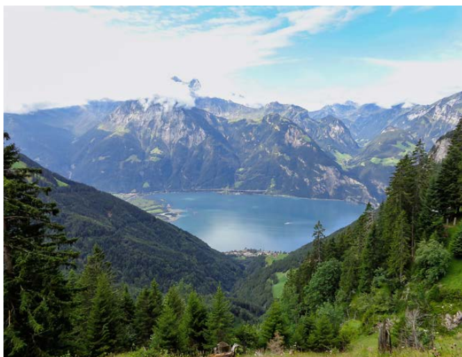
Der Aufstieg hat sich gelohnt: Blick vom Rophaien auf den Vierwaldstättersee

Flaka: «Mit der Seilbahn zu fahren war schrecklich für mich. Die Wasserfälle haben mir hingegen besonders gefallen. Der Ausblick von der Terrasse «Seeblick» war toll!»