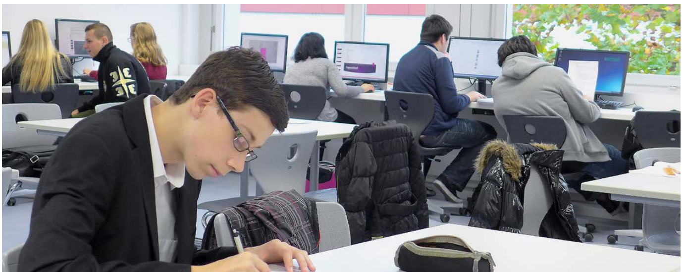
Lernende des Brückenangebots arbeiten im neu eingerichteten Lernstudio.