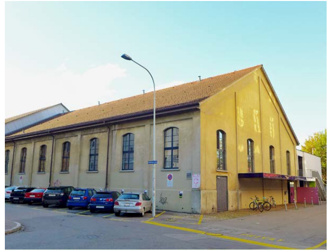
Oben: Der 1934 erbaute Gebäudeteil an der Ecke Apfelhausenweg/ Kasernenstrasse; unten: Blick ins Halleninnere

Quellen: Thomas Nadler, Architekt, Aarau; Reto Nussbaumer, Kantonale Denkmalpflege, Aarau; Reitverein Aarau.