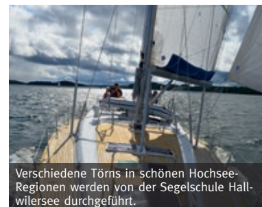
Verschiedene Törns in schönen Hochseeregionen werden von der Segelschule Hallwilersee durchgeführt.