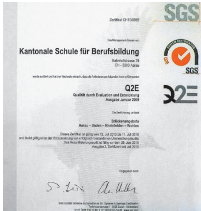
Alle Mitarbeitenden der ksb haben einen Beitrag zur Erlangung des Zertifikats Q2E geleistet.

In Teams, die aus Lehrpersonen bestehen, wurden bereits Teilprojekte in Angriff genommen: So soll zum Beispiel der Fokus auf Lernende mit Mehrfachproblematiken gerichtet werden. Aber auch beim schulischen Angebot soll überprüft werden, ob den Bedürfnissen der Lernenden auf ihrem Weg in eine Ausbildung auf der Sekundarstufe II vollumfänglich entsprochen wird. Die Ergebnisse dieser Teamarbeit bilden die Grundlage für weitere Schritte. ■