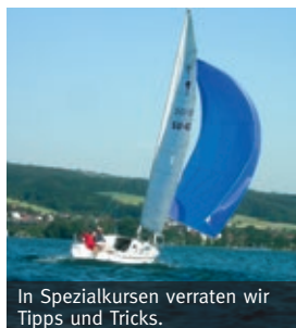
In Spezialkursen verraten wir Tipps und Tricks.

Haben Sie Lust, einmal auf dem Meer mit einer Segeljacht unterwegs zu sein? Die Segelschule Hallwilersee bietet die ganze Ausbildung an, von der Vorbereitung zur theoretischen Prüfung bis zu Ausbildungstörns auf dem Meer.