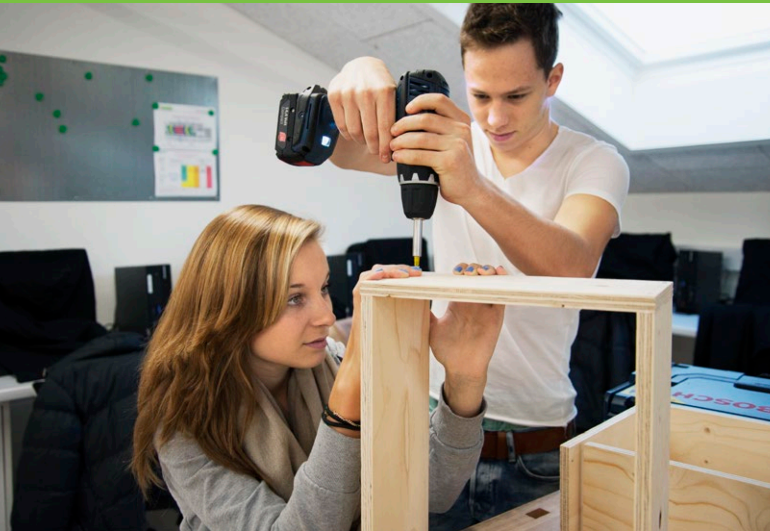
Zur Qualitätsentwicklung gehört auch genaues Hinschauen: Lernende im Werkstattunterricht.

Wie an der ksb Qualität geprüft und weiterentwickelt wird