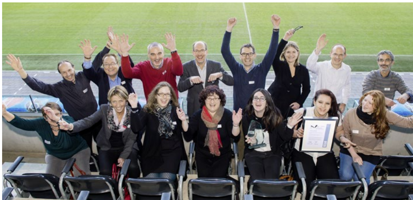
Die Delegation der ksb jubelt im Stade de Suisse.

Mit dem Schweizer Schulpreis setzt der Verein «Forum Bildung», unterstützt von Stiftungen, Wirtschaft und Kantonen, ein Zeichen für eine zukunftsgerichtete Entwicklung im Schweizer Bildungswesen. Der Preis will vorbildliche pädagogische Ideen und Konzepte einer breiten Öffentlichkeit bekannt machen. Die Preisverleihung fand 2013 zum ersten Mal statt.