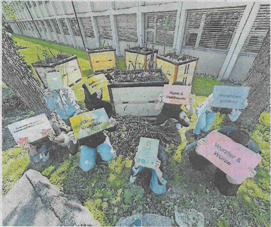
Die Klasse A72 der Kantonalen Schule für Berufsbildung (KSB) hat Erfahrungen im Gärtnern gesammelt.