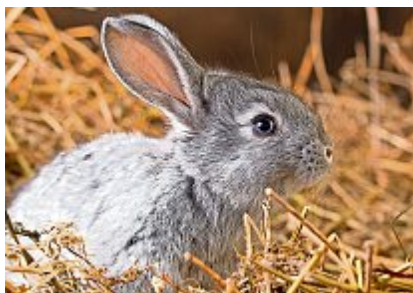
Junge Chüngeli können bewundert werden. (Symbolbild)

Erlinsbach Am nächsten Wochenende gibts Kleintiere zu bewundern. In der Festwirtschaft gibt es ein Tortenbuffet, den feinen Chüngelikafi und Burger nach eigenem Rezept. Eine Naturschutzcke bie-