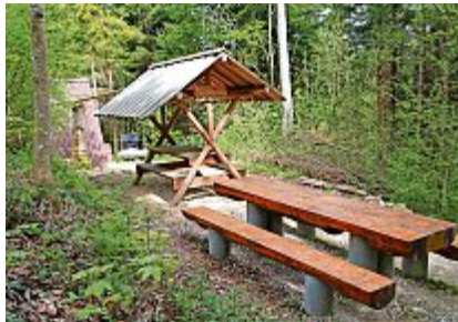
Diese Grillstelle hat die Seniorengruppe unter anderem gebaut und aufgestellt.