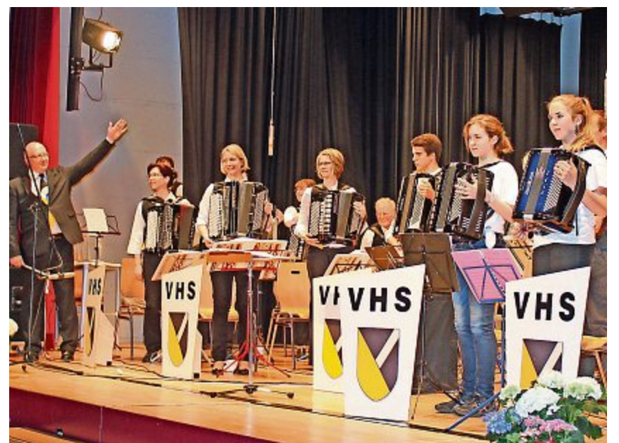
Das Jahreskonzert der Harmonikaspieler in Küttigen war ein voller Erfolg.