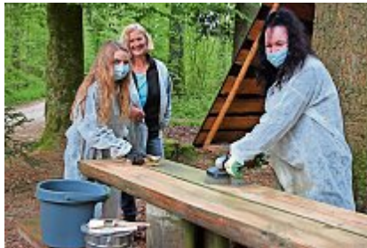
An einer Station brachten Schülerinnen einen Grilltisch wieder auf Vordermann.