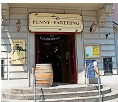
Das Penny's an der Bahnhofstrasse. lve

Mehrere Personen beteiligten sich in der vergangenen Woche vor dem Penny Farthing an einer Schlägerei. Verschiedene Beteiligte erlitten leichte Blessuren. Ein Angreifer wurde festgenommen.